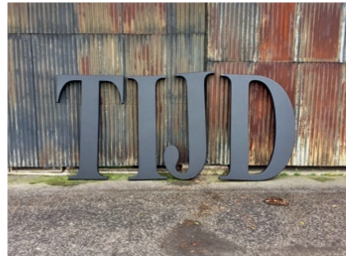
Een gewichtig woord, voettocht met het eenwoordgedicht TIJD / Ein gewichtiges Wort, Fußmarsch mit dem Einwortgedicht ZEIT