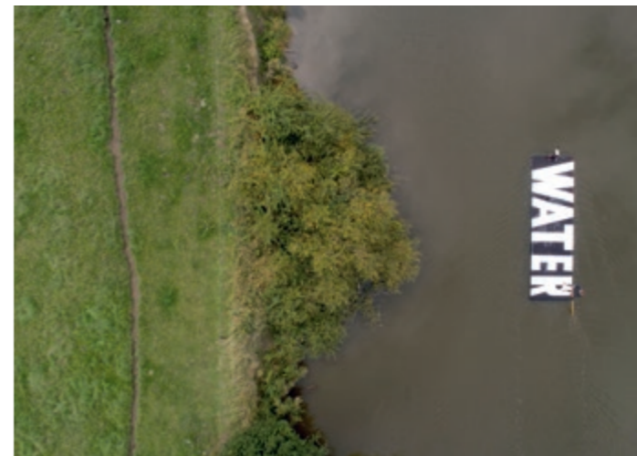
Een boom een boot een mens, het eenwoordgedicht WATER op de IJzer / Ein Baum ein Boot ein Mensch, das Einwortgedicht WASSER auf der IJzer